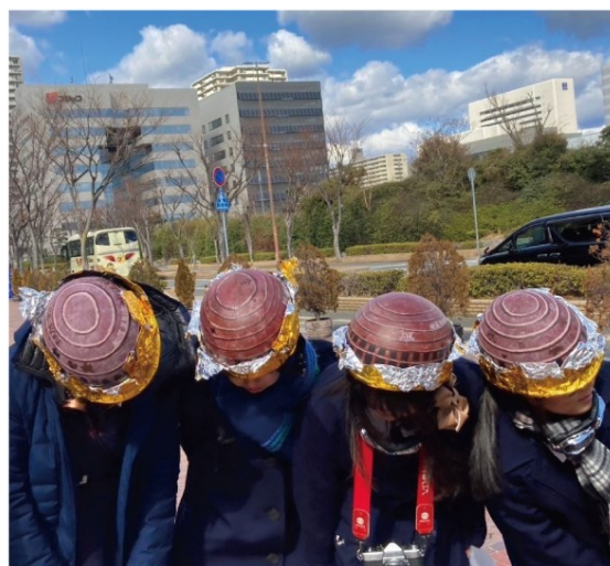
ワールド記念ホール型ヘルメット装着！ イベント時には何か被らないと落ち着かない！