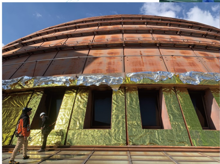
高さ4メートル、全長60メートルの巨大アート作品！ 2025年2月、ワールド記念ホールはチョコになりました。