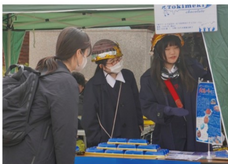
お客様ひとりひとりに主旨を説明し、 チョコ約1000箱を販売しました！