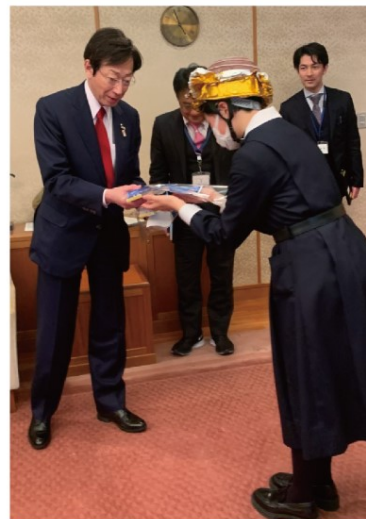
神戸市長にチョコ渡し隊。