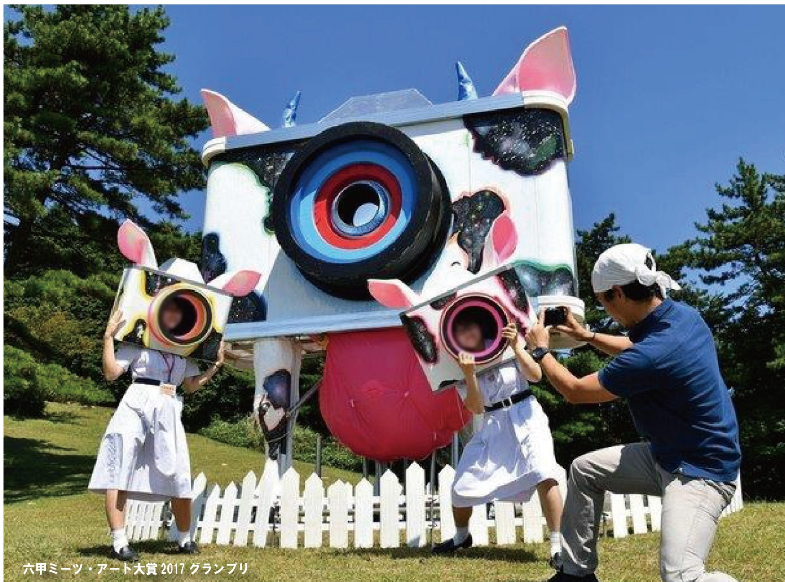
六甲ミーツ・アート大賞 2017 グランプリ

六甲ミーツ・アート芸術散歩は、六甲山の自然の中でおこなわれる芸術祭。雄大な自然をバックに記念写真を撮影する人々そのものを素材とし、笑顔の合言葉「ハイ・チーズ！」を復権すべく、六甲山にチーズと笑顔を配り歩きました。