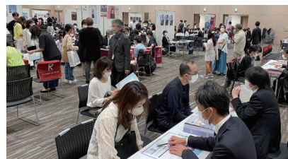
ブース個別相談の様子(イメージ)

追手門学院中学校、大阪桐蔭中学校、開明中学校、関西大倉中学校、関西大学中等部、関西大学第一中学校、関西大学北陽中学校、関西学院中学部、近畿大学附属中学校、金蘭千里中学校、啓明学院中学校、神戸山手グローバル中学校(2025年度から校名変更、共学化)、神戸龍谷中学校、三田学園中学校、常翔学園中学校、須磨学園中学校、須磨学園夙川中学校、清風南海中学校、高槻中学校、滝川中学校、智辯学園和歌山中学校、帝塚山中学校、同志社中学校、同志社国際中学校、同志社香里中学校、奈良学園中学校、奈良学園登美ヶ丘中学校、西大和学園中学校、初芝立命館中学校、雲雀丘学園中学校、箕面自由学園中学校、桃山学院中学校、洛南高等学校附属中学校、履正社中学校、立命館宇治中学校、立命館守山中学校