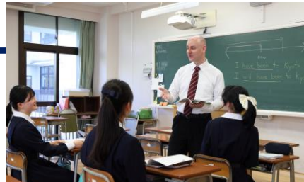
ICT活用・課題解決力(探究の学び)

探究学習では、興味のあるテーマについて、生徒同士協力しながら、調べる、発表する、レポートを作成するなどの活動に取り組みます。探究学習で身に付ける思考力・表現力・協働力は、これからの世界で求められる大事な力です。またこれらの力は、総合型選抜(AO入試)にもいかされます。