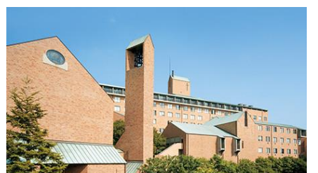
併設の神戸松蔭大学

神戸大学のすぐ側に位置する併設の神戸松蔭大学への内部進学も保証。(英検等の条件有り) この大学は、2025年度入学生からの共学化が決定済です。これに伴い、大学名称も「神戸松蔭女子学院大学」から「神戸松蔭大学」へ変更となる予定です。非常に面倒見の良い大学です。その結果、毎年高い就職率を記録しています。例年約20~30%の卒業生が内部進学しています。松蔭高校出身者のみの奨学金制度もあります。(資格条件あり)