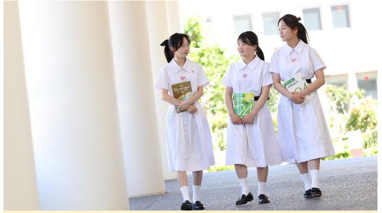
“Open Heart, Open Mind” がスクールモットー