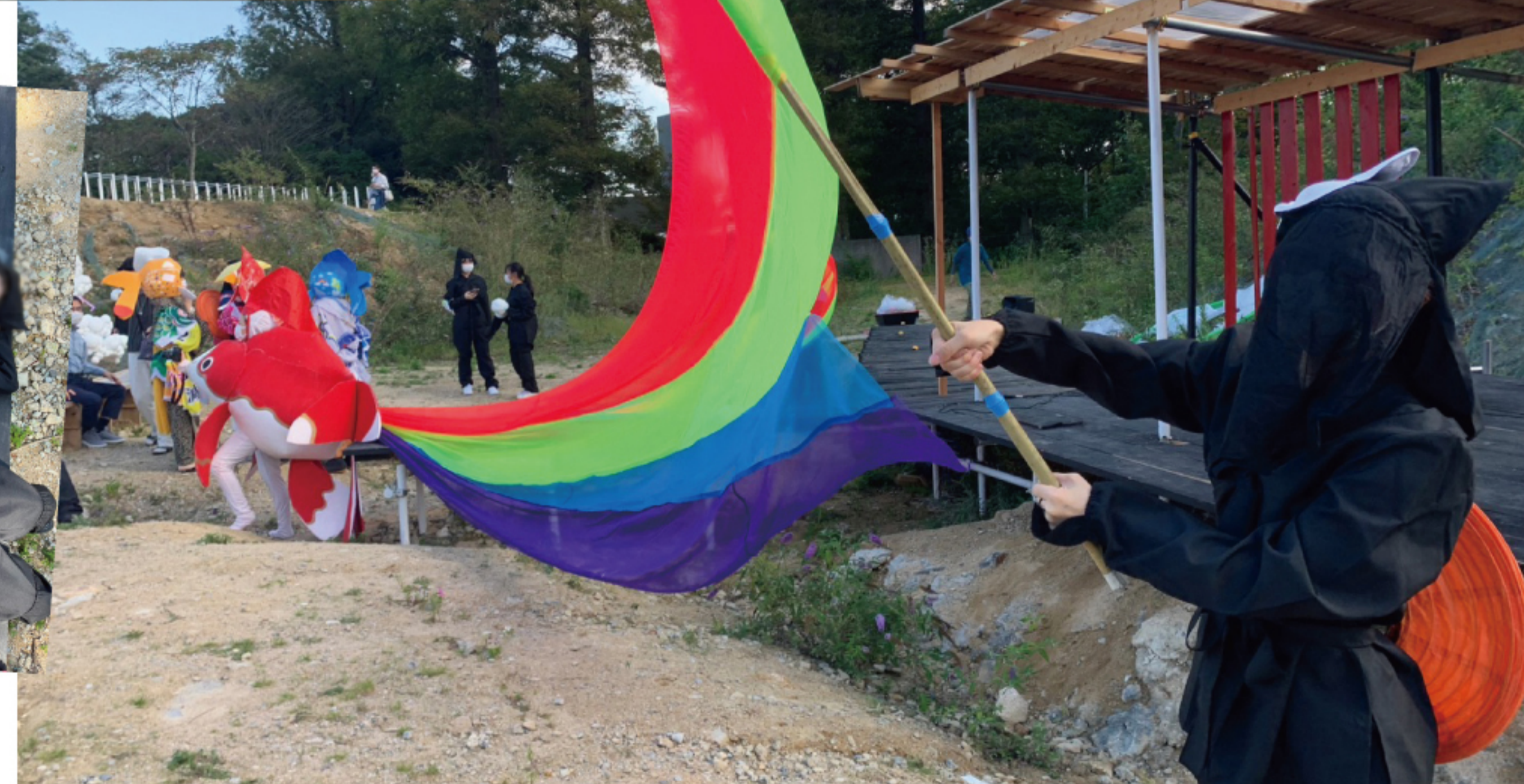
陰で支える黒子ちゃんたち ↑ →