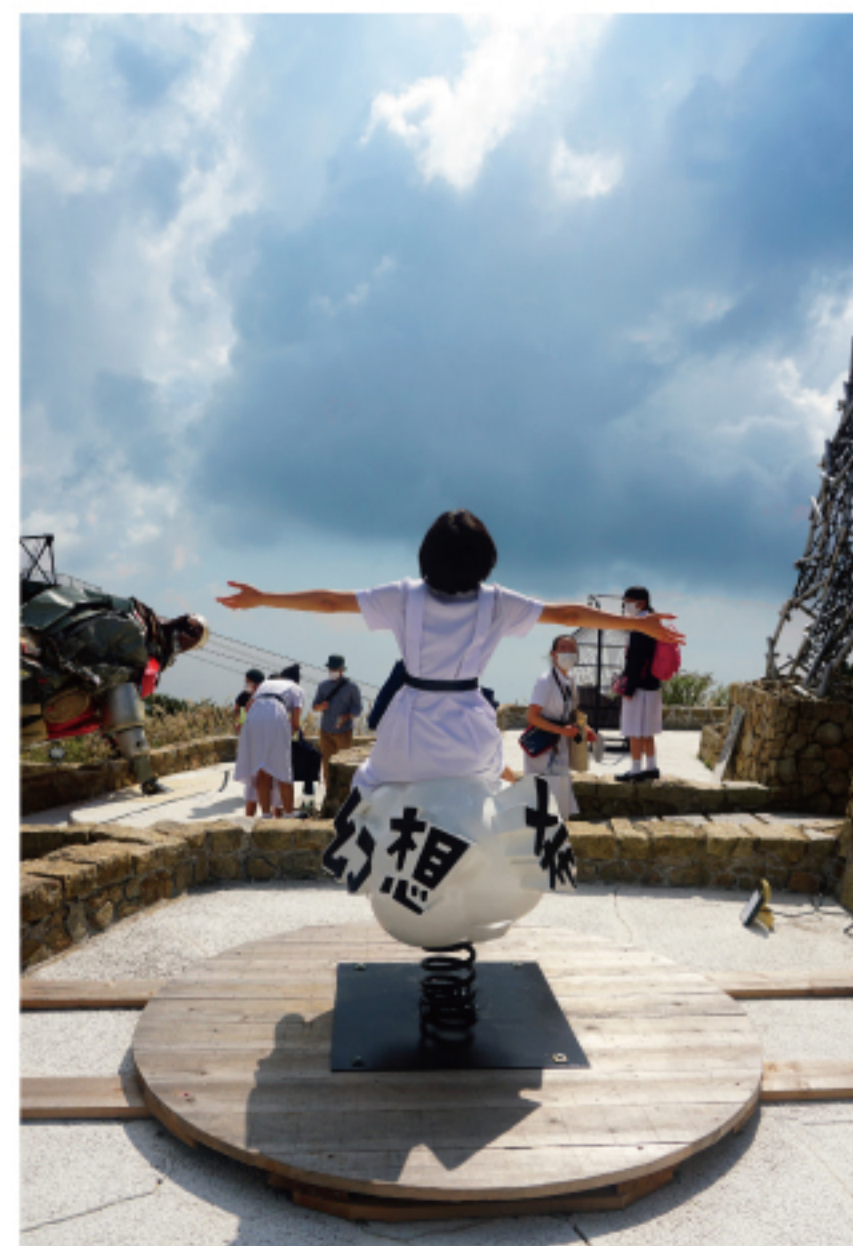
佐川好弘 《シダレミュージアム》