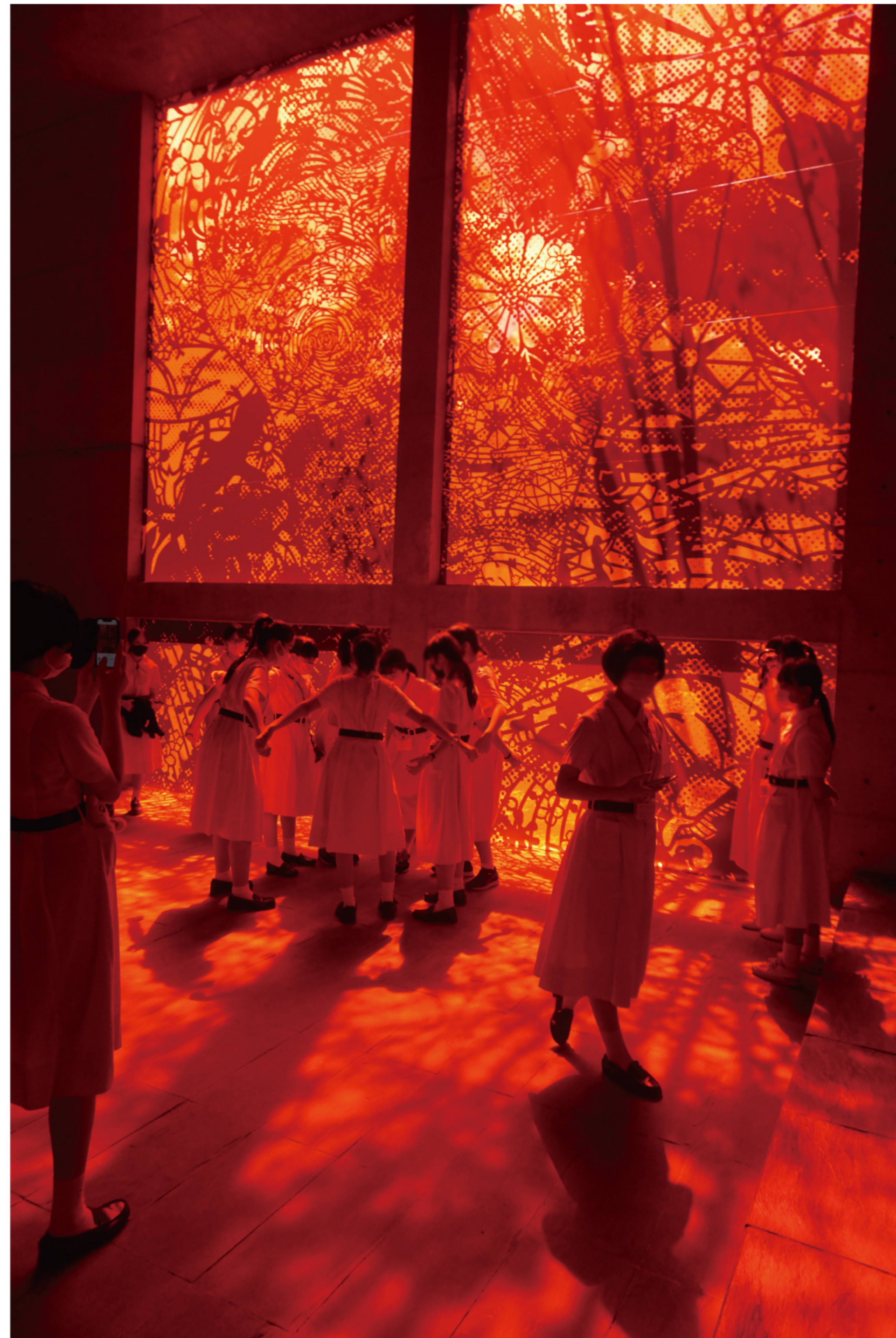
大巻 伸嗣《そらのあな》