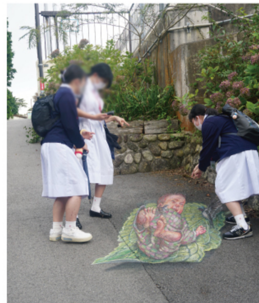
松本かなこ《温和な庭》