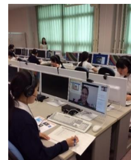
<オンライン英会話>

8月25日には、高校生の環境問題についてのプロジェクト型学習、Blue Earth Projectの全国活動報告会を開催します。2006年から始まったこの取り組みは、現在では高校全体の取り組みとなり、全国の高校生が参加するようになりました。今回、北海道から沖縄まで十数校の女子高生たちが、それぞれの活動を報告し交流を深めます。お気軽にご見学ください。参加申し込みは、学校ホームページのBlue Earth Projectのバナーからできるようになっています。（裏面に続く）