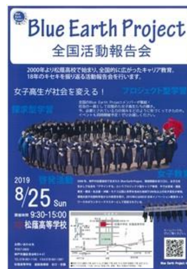
<全国報告会のチラシ（学校HPより）>