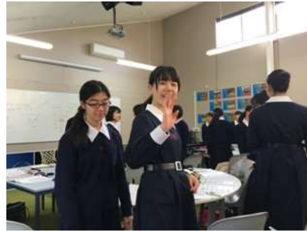
日本語クラスとの合同授業